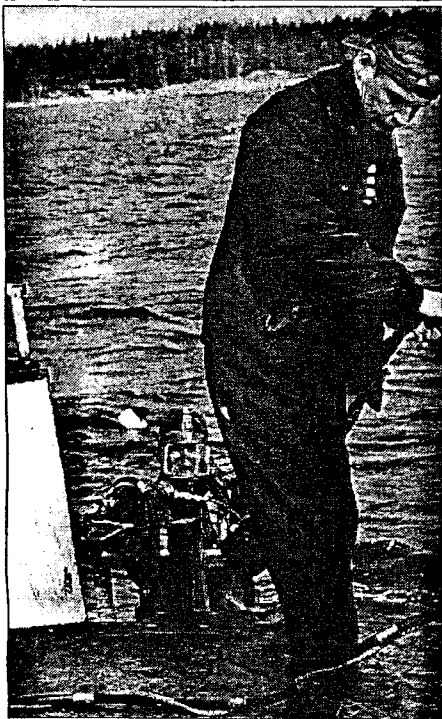
Lotkulla sukeltajan turvaköysi on yhdistetty ilmaletkuun. Köyden sisällä kulkee puhonimen kaapeli ja sukeltajan puha kuuluu kannella olevasta kaluttimesta.