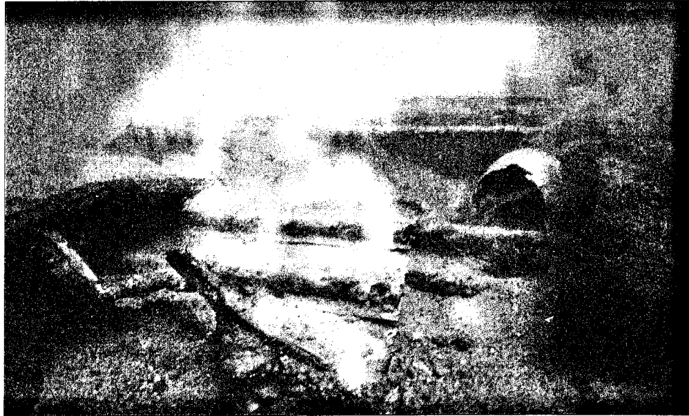
Avhventen seurassa meren pohjassa makaava hylky on kaivettu esiin hiekasta.

Suomalainen tiedusteluyksikö raportoi tapahtumasta tiedus-